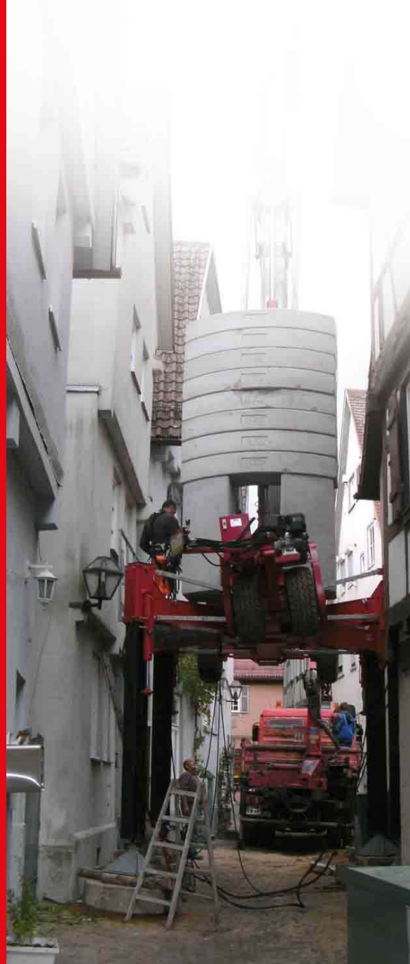
(Abb. oben): Unterfahrbares Portal