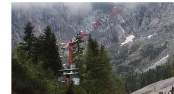
(Abb. oben): Beim Bauprojekt der Höllentalangerhütte des DAV mußten die Kranteile mit dem Helikopter angeliefert werden, da die Lage nicht mit Fahrzeugen zu erreichen ist.

Unsere Vielfältigkeit ist Ihr großer Vorteil. Wir haben die Möglichkeit aus einem großen Mietpark Serienkrane und Spezialbauten anzubieten. Für den Alpin-Bereich wurde von uns ein Kranmodell umkonstruiert und technisch verändert. Unser Kranmodell TDK 3510-40 ist auch mit einem Serienhelikopter montierbar.